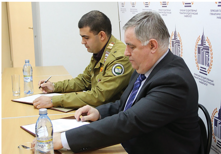
Подписание Соглашения о сотрудничестве между Советом ректоров вузов Пермского края и Пермским региональным отделением МООО «Российские Студенческие Отряды», 2018 год.